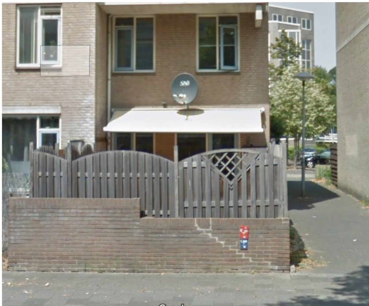
Schermafbeelding_2025-04-21_205415.png op 21-04-2025 21:11 door melder